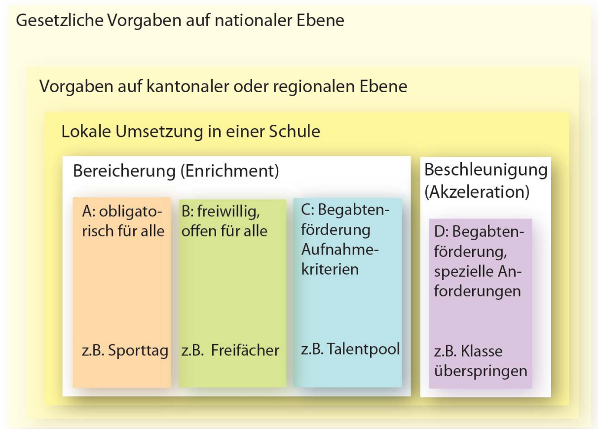
Abb. 1: Modell der Begabungs- und Begabtenförderung. Verschiedene Ebenen der Begabungs- und Begabtenförderung (Kantonsschule Wettingen, Caterina Savi)

Folgende Darstellung veranschaulicht die verschiedenen Ebenen der Begabungs- und Begabtenförderung.